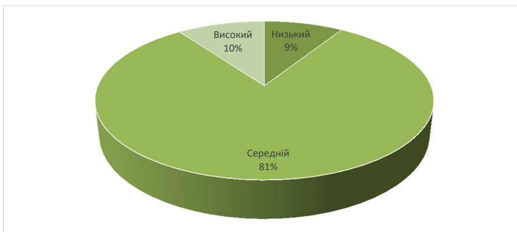
Рис. 1. Стан розвитку емоційної стійкості у майбутніх психологів (за 16-факторним опитувальником Р. Кеттела)

Шкала «Позитивні взаємини з іншими» характеризується найвищою часткою середнього рівня (60%) при відносно помірному низькому (25%) та мінімальному високому (14%). Це ймовірно свідчить про збереження базової здатності студентів до міжособистісної взаємодії та підтримки соціальних зв'язків, проте вказує на дефіцит глибоких довірчих стосунків, що є закономірним